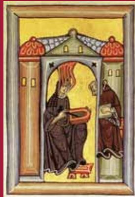
Hildegard von Bingen empfängt eine göttliche Inspiration. Miniatur aus dem Rupertsberger Codex des Liber Scivias.

Hildegard von Bingen gehört zu den herausragenden Frauengestalten des europäischen Mittelalters. Als Zeitgenossin Friedrich Barbarossas, Eleonore von Aquitanien, Abaelards und Bernhards von Clairvaux gelang es der Äbtissin und benediktinischen Ordensfrau, tradierte Wissensgrenzen und Rollenbilder zu sprengen und ein zeitloses Lebenswerk zu schaffen.