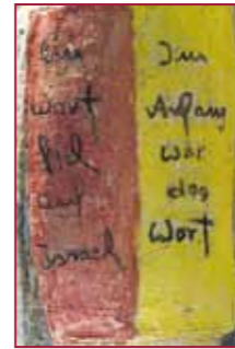
CHRISTOPHORA JANSSEN KERAMIK