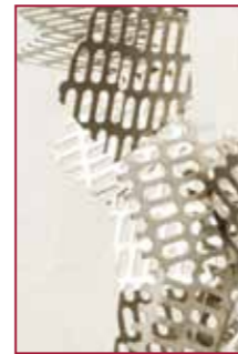
THOMAS LINDNER SKULPTUR & FOTOCOLLAGE