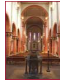
1 St. Hildegard Gedächtniskirche Bingerbrück www.rupertsberg.de LVM I – Die Mitte der Schöpfung