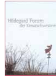
2 Hildegard-Forum der Kreuzschwwestern auf dem Rochusberg Bingen www.hildegard-forum.de LVM II – Die Flügel der Schau