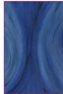
SABINE BÖHM MALEREI