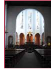
4 Pfarrkirche St. Jakobus Rüdesheim am Rhein www.sanktjakobusruedesheim.de LVM IV – Urstoff der Menschlichkeit