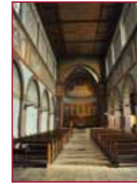
3 Klosterkirche der Abtei St. Hildegard Rüdesheim-Eibingen www.abtei-st-hildegard.de LVM III – Die Klage der Elemente