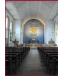
5 Pfarrkirche St. Hildegard Eibingen www.eibingen.de/pfarrei LVM VI – Die Wasser der Tiefe LVM VI – Eine neue Erde